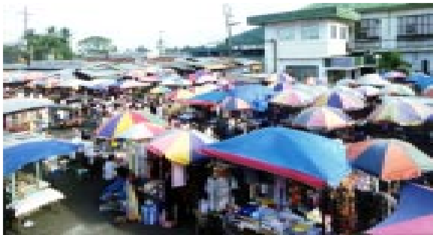
TINDAHANG PANGTINGGI (STREET VENDORS)

G7. Sabihin sa salita ang pumapasok sa isipan kapag nakatinggin sa litrato ng tindahang pangtinggi (vendors). Ipakita ang litrato # 9.