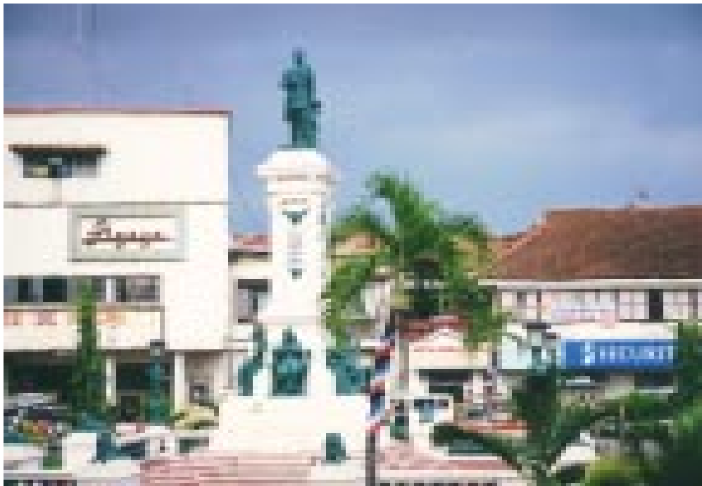
BANTAYOG NI RIZAL

E4. Sabihin sa salita ang pumapasok sa isipan kapag nakatinggin sa litrato ng bantayog ni Rizal (ipakita ang litrato #5).