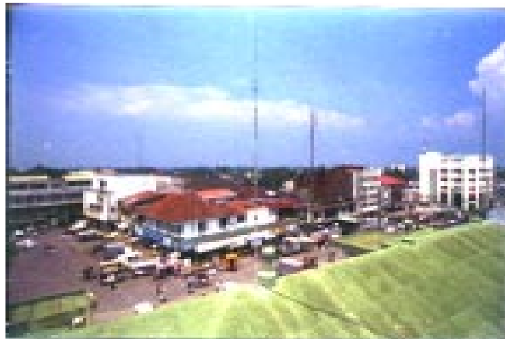
TINDAHANG MAY PUWESTO (RETAIL SHOPS) SA HARAP NG PALENGKE AT BANTAYOG NI RIZAL