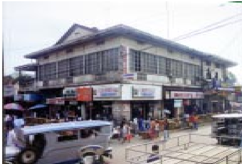
TINDAHANG MAY PUWESTO (RETAIL SHOPS) SA TABI NG LARUANG PANG BASKETBOL

F8. Sabihin sa salita ang pumapasok sa isipan kapag nakatinggin sa litrato ng mga tindahanang may puwesto (retail shops) Ipakita ang litrato #6, #7, & #8.