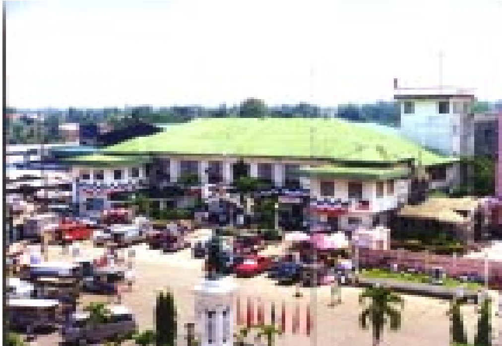
MUNISIPYO NG BINAN

B7. Sabihin sa salita ang pumapasok sa isipan kapag nakatinggin sa litrato ng munisipyo (ipakita ang litrato # 2) ?