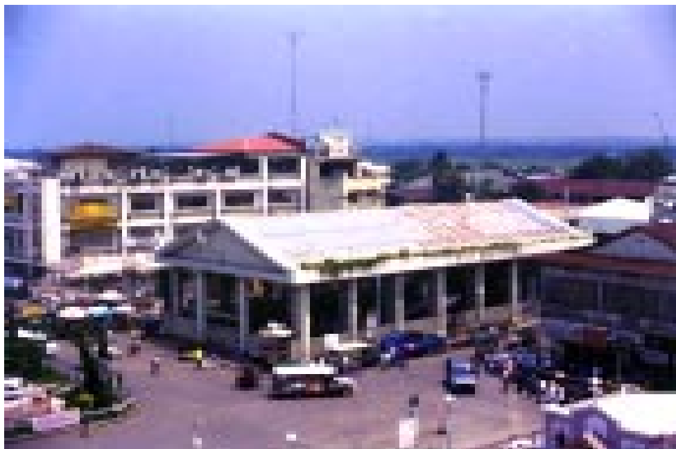
LARUANG PANG BASKETBOL

D7. Sabihin sa salita ang pumapasok sa isipan kapag nakatinggin sa litrato ng laruang pang basketball/tanggapan ng koreo (ipakita ang litrato #4).