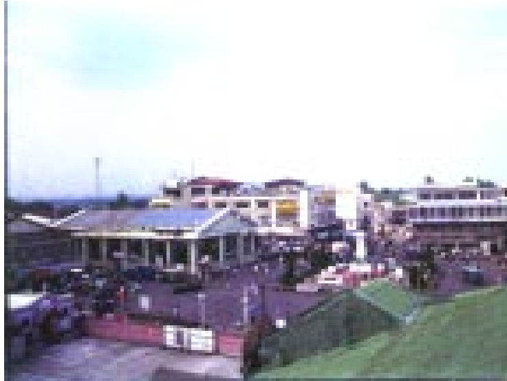
TINDAHANG MAY PUWESTO (RETAIL SHOPS) SA HARAPAN AT TABI NG MONUMENTO