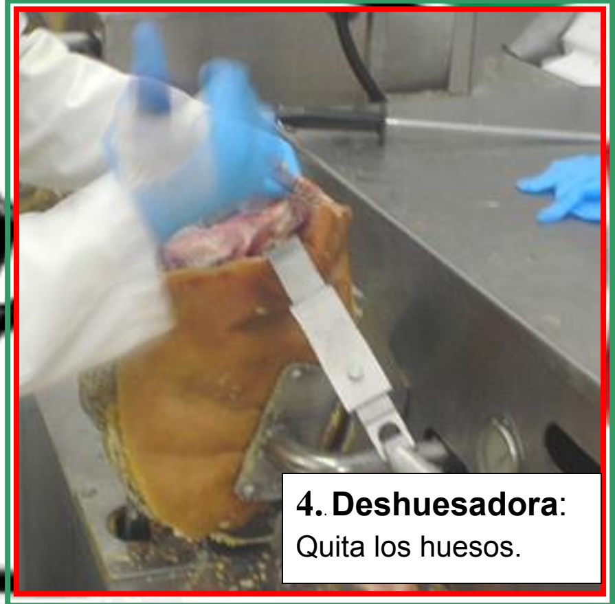
4. Deseñadora: Quita los huesos.