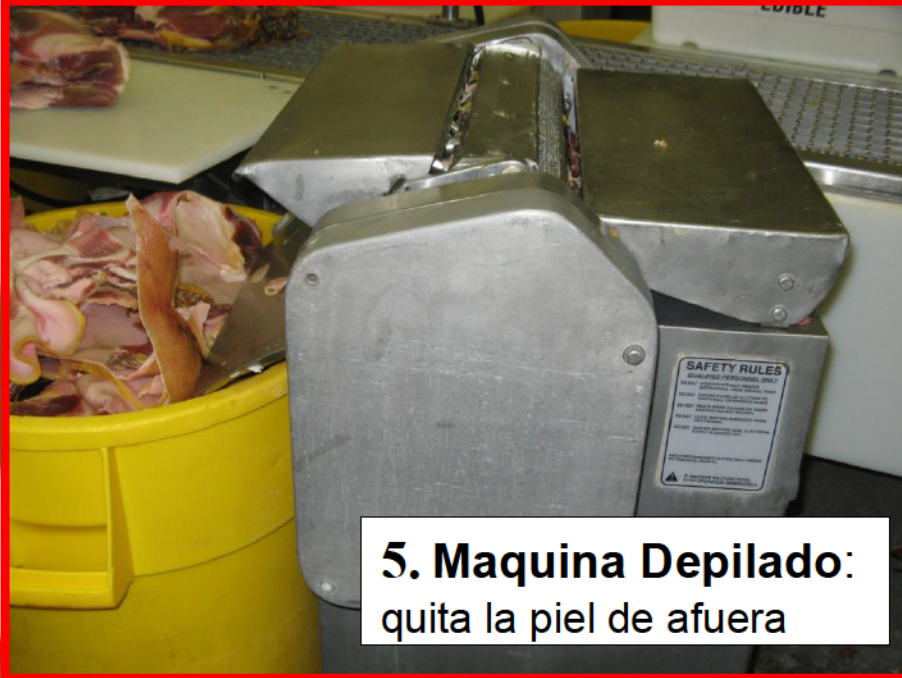
5. Maquina Depilado: quita la piel de afuera