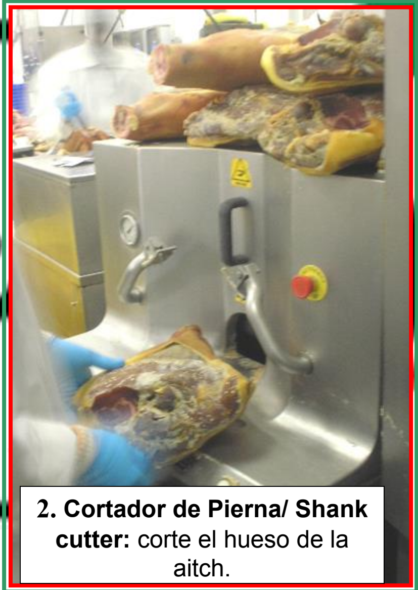
2. Cortador de Pierna/ Shank cutter: corte el hueso de la aitch.