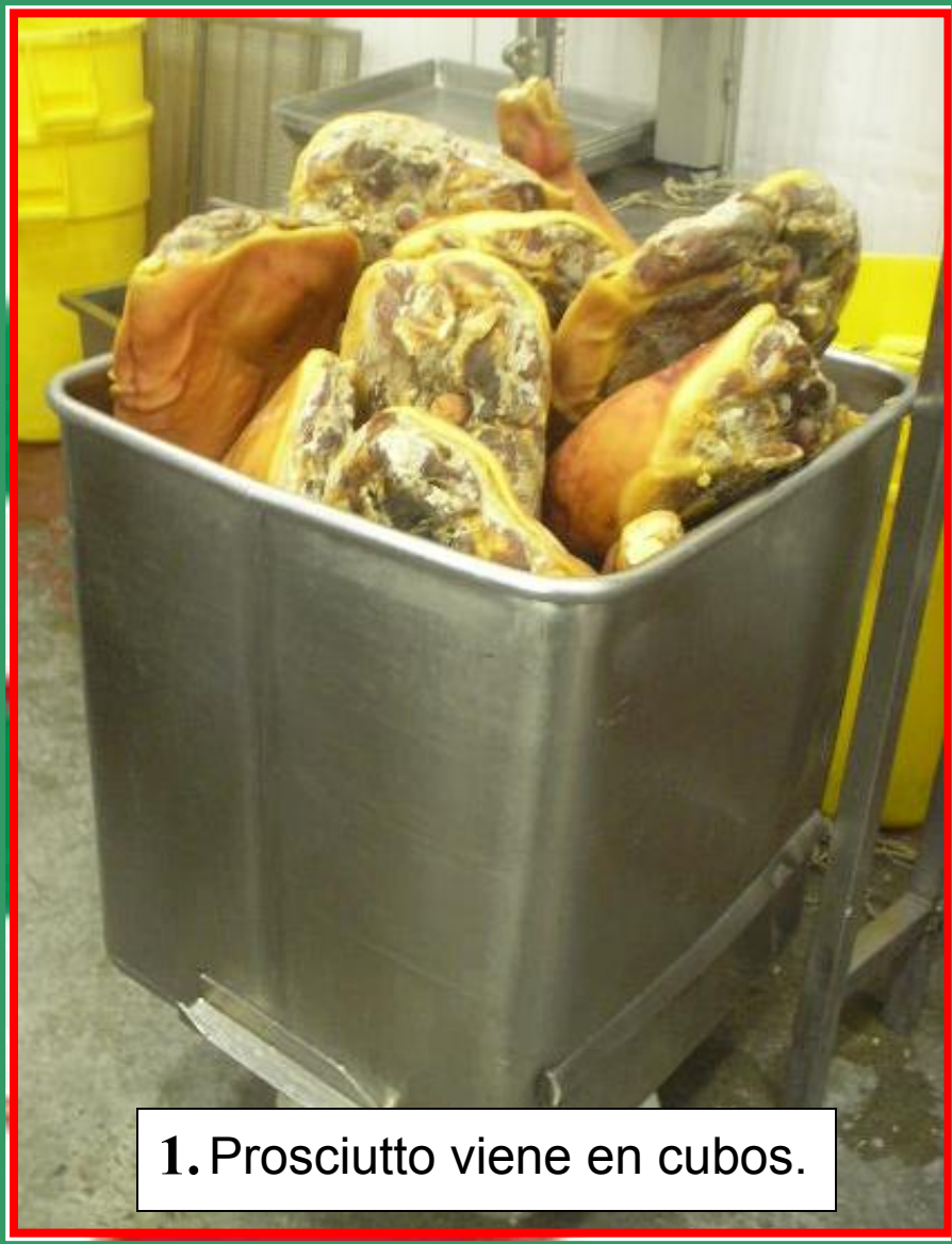
1. Prosciutto viene en cubos.