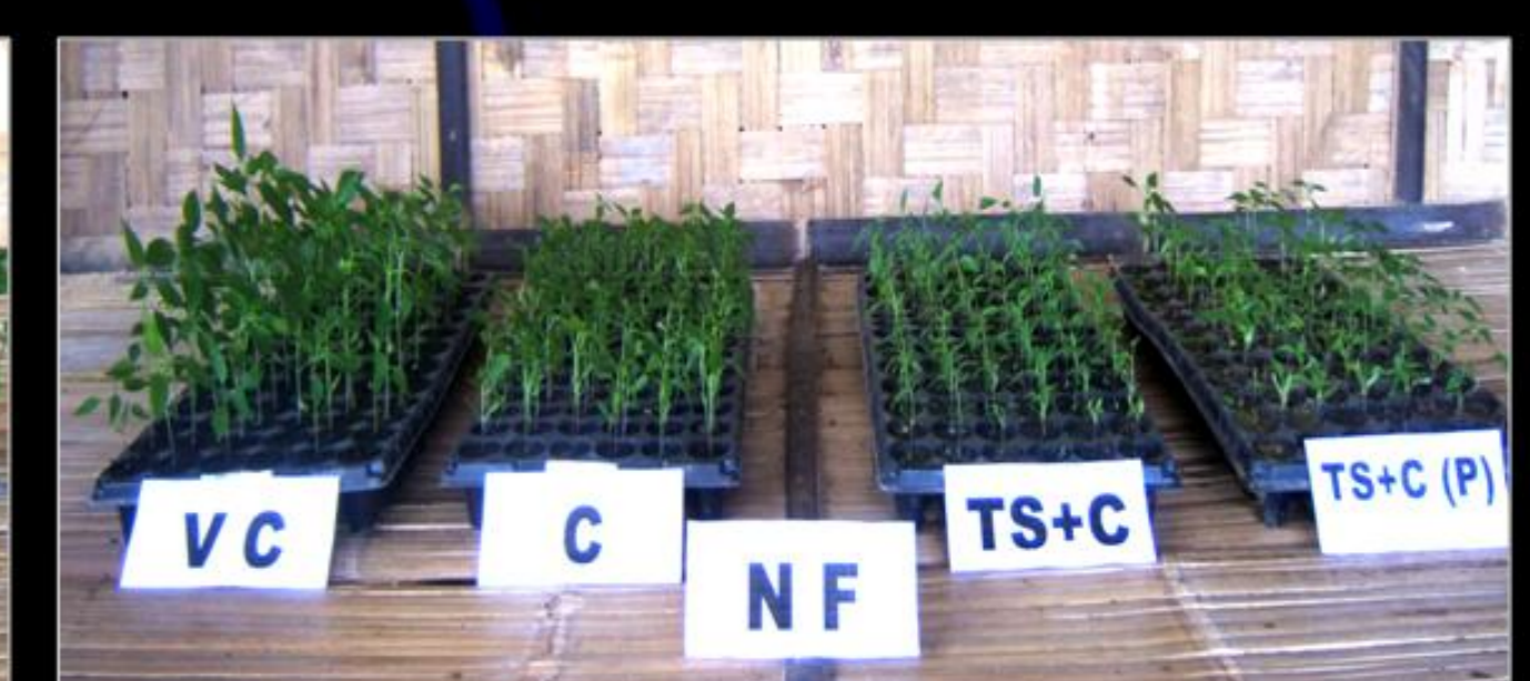
Gambar 4. Persemaian cabai tanpa perlakuan pemupukan, berurutan dari kiri; cabai pada media kascing, kompos, topsoil+kompos dan topsoil+kompos yang dipasteurisasi