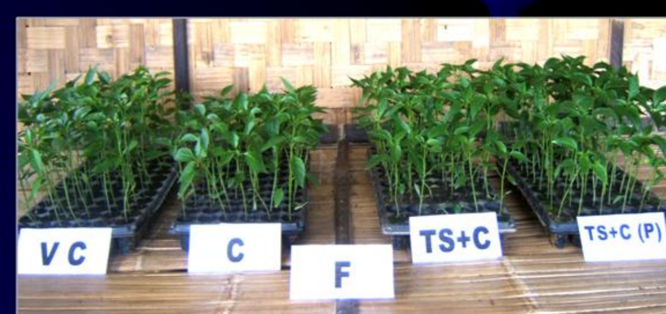
Gambar 3. Persemaian cabai dengan perlakuan pemupukan, berurutan dari kiri; cabai pada media kascing, kompos, topsoil+kompos dan topsoil+kompos yang dipasteurisasi