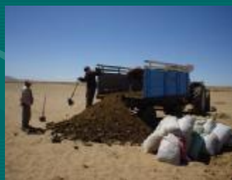
Abono orgánico (guano)