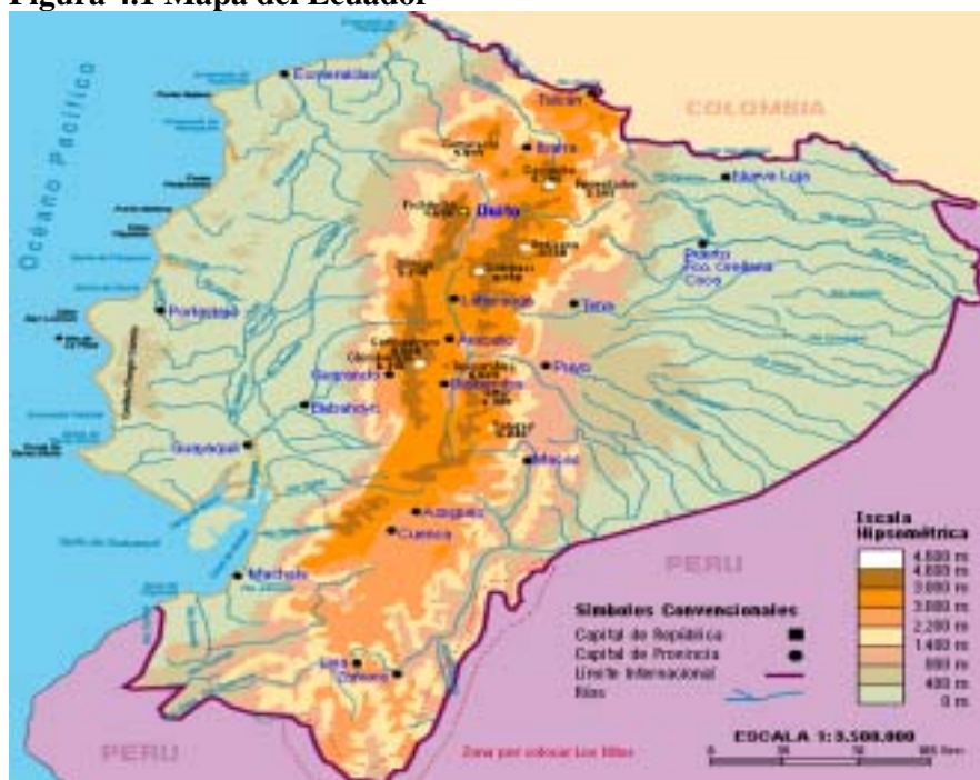
Figura 4.1 Mapa del Ecuador

El Ecuador presenta cuatro regiones naturales diferenciadas: la Costa, la Sierra o la zona de altura, la Amazonía u Oriente y la zona insular o Galápagos. Como ya se mencionó el ámbito geográfico del presente estudio corresponde al de PROFAFOR, es decir la Costa y Sierra del Ecuador. Sin embargo, los casos de estudio se desarrollaron en comunidades ubicadas en las provincias Imbabura, Cotopaxi y Chimborazo, todas dentro de la Sierra, por tanto en la presente sección se describe las características de esta región del país.